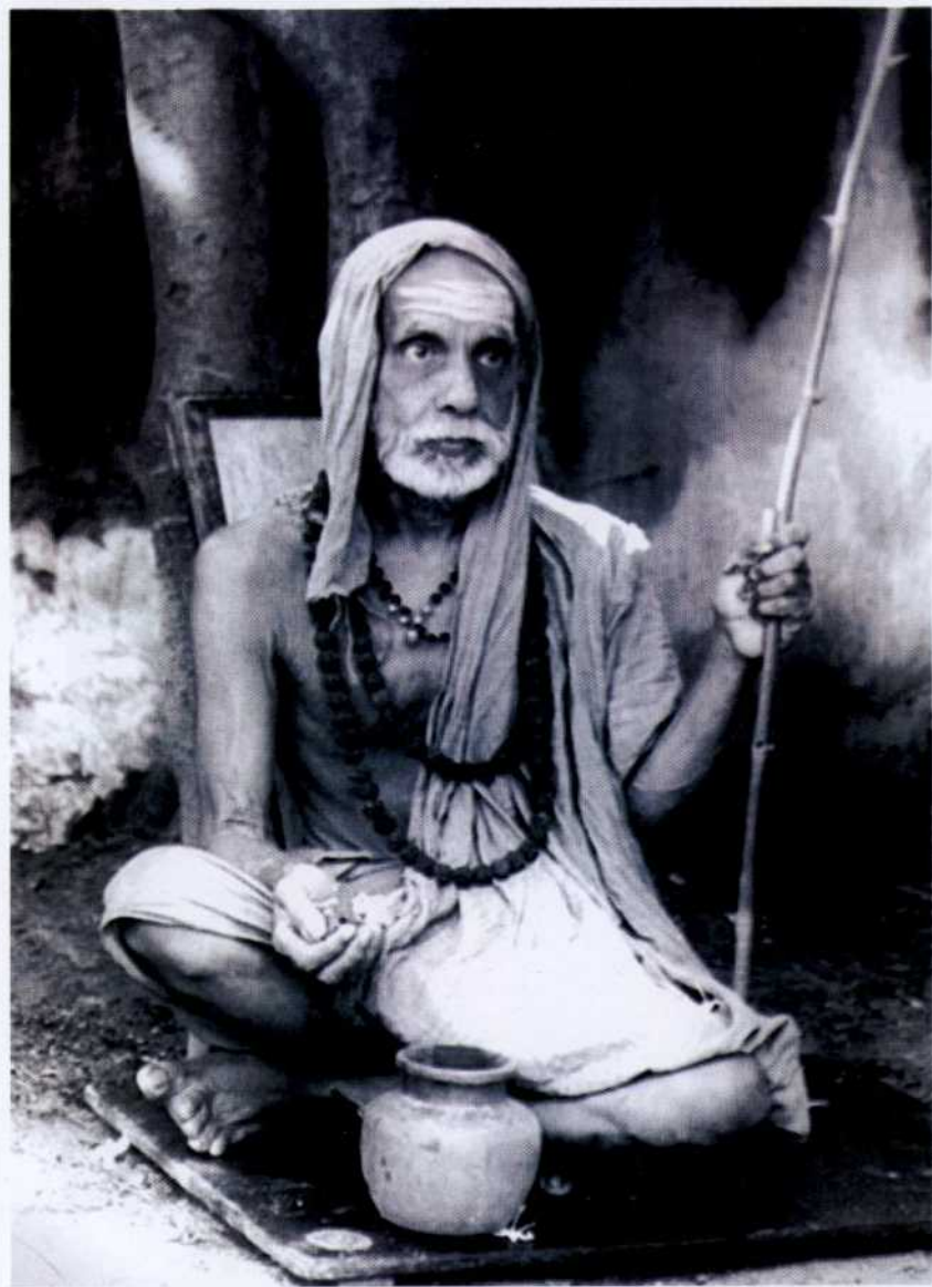
His Holiness Sri Chandrasekharendra Saraswati Swamigal of Kanchi Mutt (1894-1994)